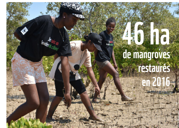
↑ Plantation participative

La restauration des mangroves contribue à l'amélioration substantielle de la vie des communautés locales : elle reverdit les espaces dégradés, protège la côte et favorise le développement des crabes, crevettes et poissons. Ces ressources halieutiques engendreront des revenus. Dans le paysage Manambolo Tsiribihina, plus de 31 000 ha de mangroves sont gérés par les communautés locales. Les surveillances aériennes ont montré que le taux de déforestation des mangroves a significativement diminué, passant de 88 ha en 2015 à seulement 13 ha en 2016. Ceci grâce, entre autres, à toutes les actions du projet WWF. ■