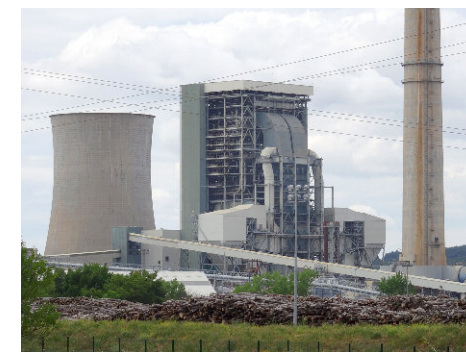
↑ La mégacentrale à biomasse d'Uniper à Gardanne

Voulant faire feux de tout bois, certains lobbyistes sont aujourd'hui très actifs. Ces lobbies que l'on connaît bien en France voudraient que n'importe quelle exploitation de bois devienne par définition, et magie, entièrement verte et neutre en carbone, biomasse-énergie industrielle comprise. A l'instar du Programme National de la Forêt et du Bois (2016-2026), certains voudraient que la politique climat soit la source de subventions pour exploiter plus encore les forêts. Quelle que soit la durée de vie des produits et la durabilité des choix de gestion (coupe rases, reboisement artificiel, etc.). Aujourd'hui, les ONG (dont le WWF) et certains gouvernements prennent clairement position pour une définition plus stricte et ambitieuse pour le climat, limités aux exploitations captant réellement du carbone. La France sera t-elle de ceux-là ? ■