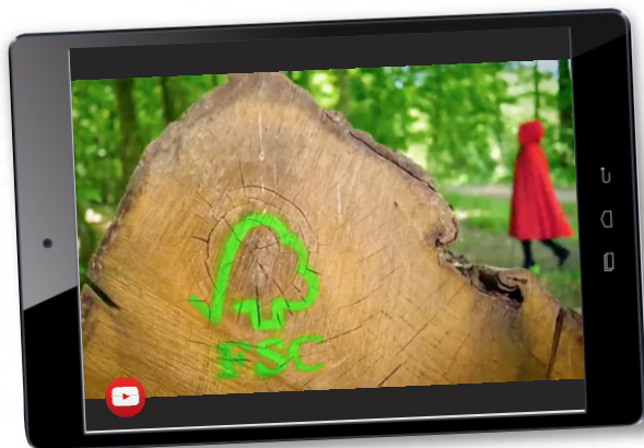
↑ Découvrez en 1 clic la vidéo réalisée à l'occasion des 10 ans de FSC France

FSC (Forest Stewardship Council®) est une organisation non gouvernementale créée en 1993, un an après le Sommet de la Terre de Rio, par la volonté d'un groupe d'entreprises, d'associations environnementales et de représentants des droits sociaux. Face au constat alarmant de la dégradation des forêts dans le monde, sa mission est de créer et promouvoir un système de certification indépendant et performant dans tous les types de forêts (boréales, tropicales et tempérées). Un contrôle régulier des forêts et des entreprises certifiées par une tierce partie indépendante garantit une gestion responsable. Ainsi promues par un label exigeant, les valeurs des forêts sont mieux partagées et préservées.